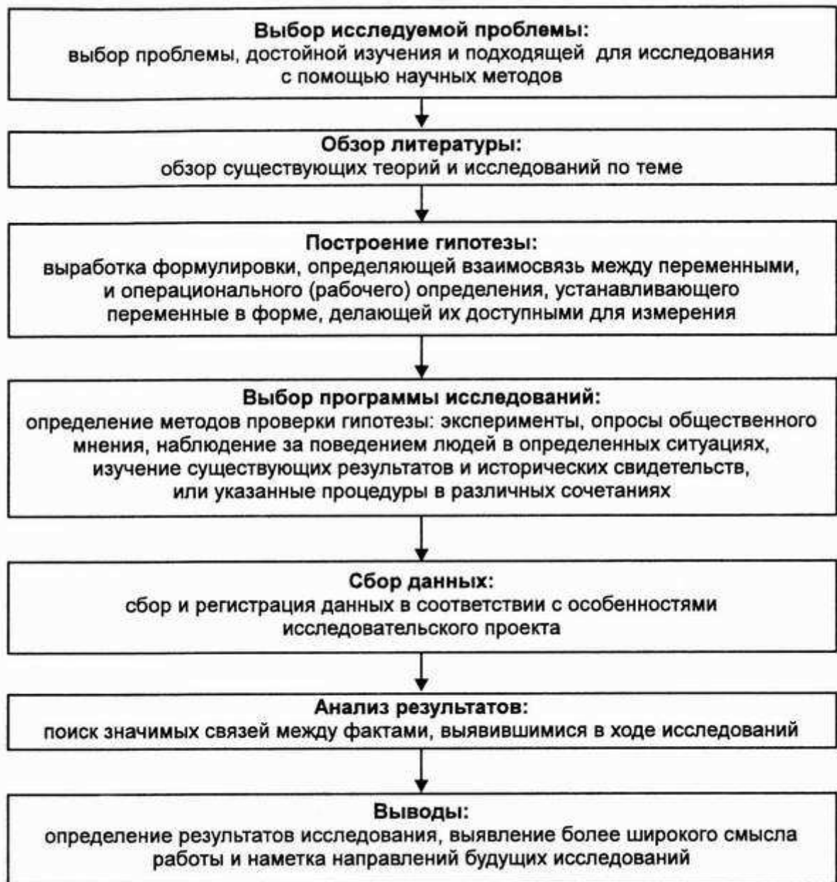
Рис. 1.6. Этапы социологического исследования