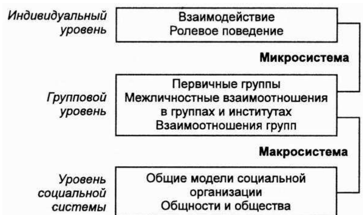
Рис. 1.3. Уровни социологического анализа

Разногласия между сторонниками макро- и микросоциологии связаны, во-первых, с пониманием предмета исследования и уровня обобщения, во-вторых, с характером использованных понятий и принципов формирования социологического знания (рис. 1.3).