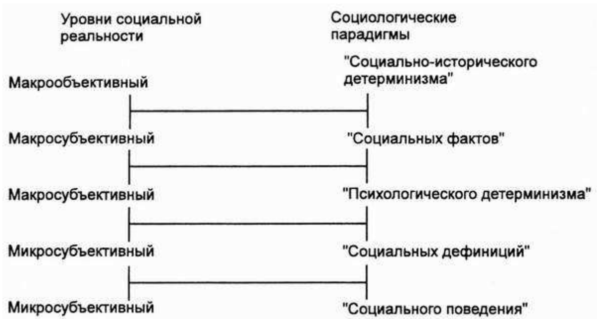
Рис. 1.5. Уровни социальной реальности и интегральная социологическая парадигма

Практически все названные парадигмы в той или иной мере представлены в отечественной социологической литературе. Преодолев идеологическое и теоретико-методологическое засилье марксизма, социология в нашей стране развивается в основном за счет восприятия западных социологических концепций.