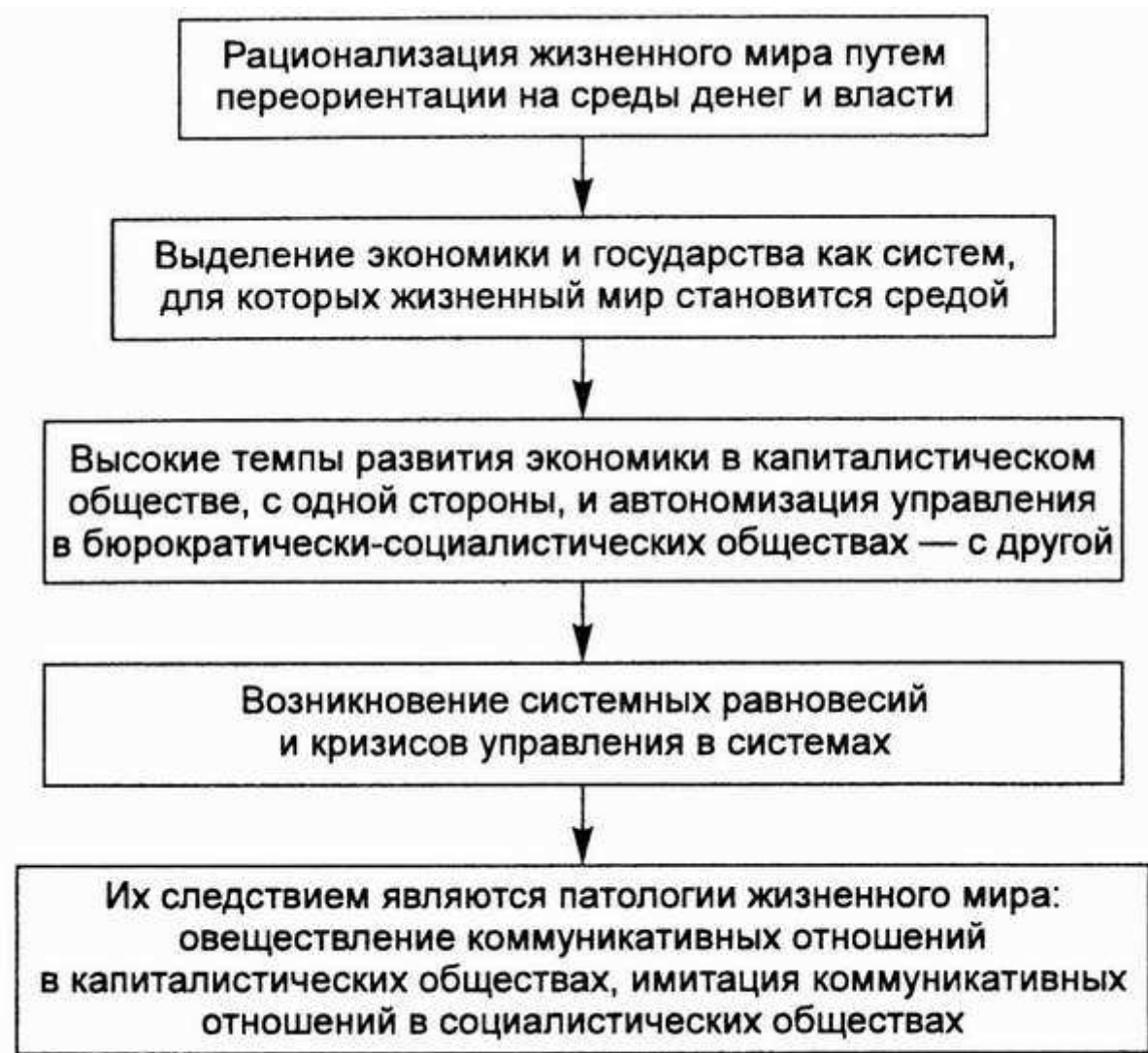
Рис. 1.2. Развитие обществ

На стыке между системой и жизненным миром возникают новые конфликты (проблематика окружающей среды, сверхсложность, перегруженность коммуникативных структур и т.п.). Поэтому невозможно понять проблемы современного общества, анализируя только системные процессы; необходима их критика на основе противоположной системному рассмотрению концепции, например, на основе анализа коммуникативного действия с позиций жизненного мира.